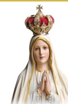
Figura Matki Boskiej Fatimskiej